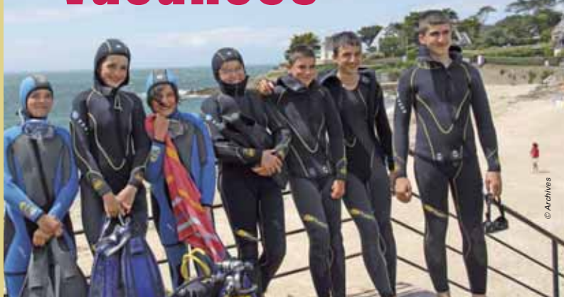
Plongée sous-marine au Croesty en juillet 2009

Vous n'avez encore rien prévu pour vos vacances d'été, vos loisirs et ceux de vos enfants? Voici quelques idées de dernière minute pour vous distraire et changer d'air sans vous ruiner.