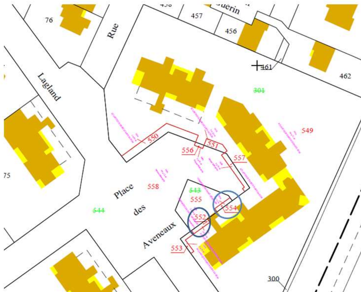
Photo : rampe escalier sur parcelle ED 554