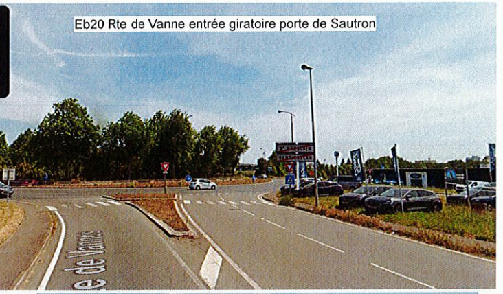
Eb20 Rte de Vanne entrée giratoire porte de Sautron