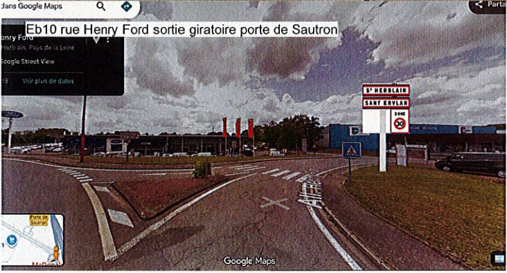
Eb10 rue Henry Ford sortie giratoire porte de Sautron