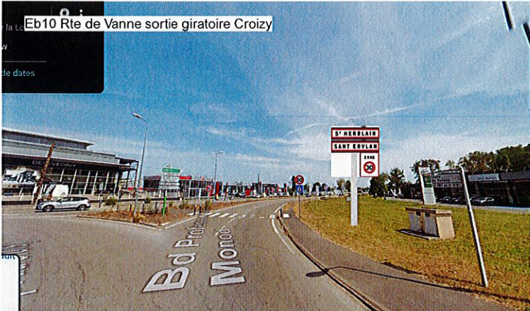
Eb10 Rte de Vanne sortie giratoire Croizy