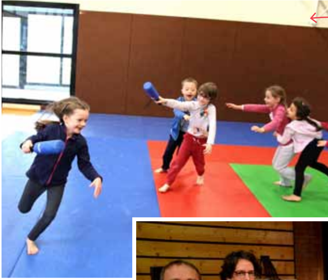
Apprentissage ludique des arts martiaux à l'ensemble sportif de l'Angevinière lors des vacances d'hiver.