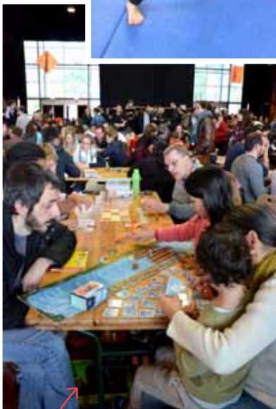
Carton plein pour le Festival des jeux cuvée 2019 ! Plus de 8 000 personnes ont participé cette année à la fête de tous les jeux.