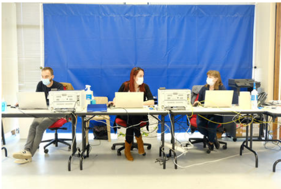
Des agents administratifs de la Ville valident la vaccination des usagers auprès de la CPAM.