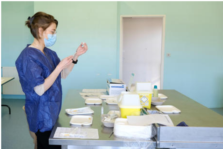
Une infirmière prépare les doses de vaccin.